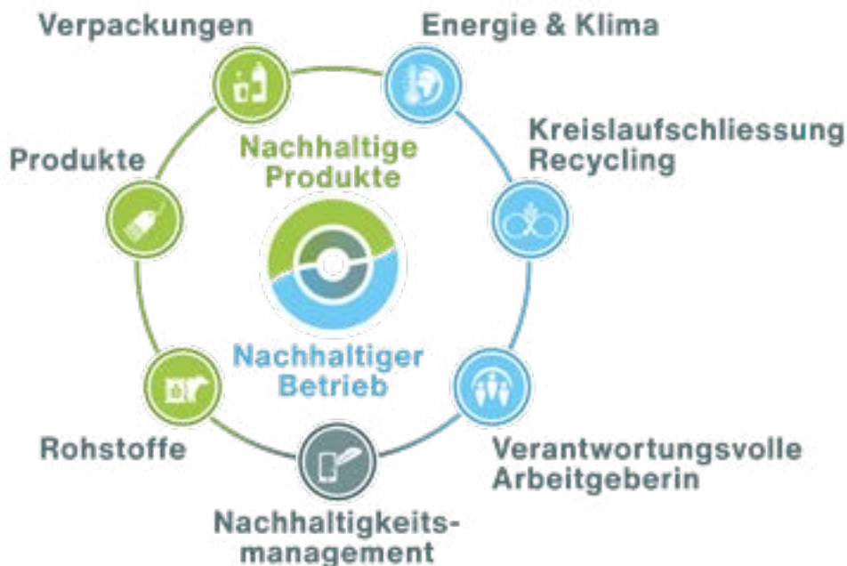
Abbildung: Zielbereiche der Nachhaltigkeitsstrategie für die Micarna-Gruppe und somit auch für Favorit Geflügel AG.

Der Zielbereich Nachhaltigkeitsmanagement umfasst die systematische Bearbeitung der Nachhaltigkeit. Das Nachhaltigkeitsmanagementsystem wird gemäss ISO 14001 zertifiziert. Der Standort von Favorit Geflügel AG (Lyss) ist seit dem Jahr 2017 nach ISO 14001 zertifiziert.